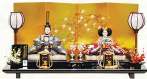
●京箔青海雲に枝桜四曲屏風 飾台 (間口70×奥行40×高さ35.5cm)