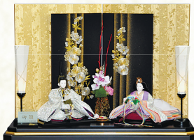
●二重屏風(桜刺繍)・黒塗飾台 (間口80×奥行43×高さ56cm)