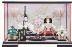
●金彩桜衣裳 (間口47×奥行33×高さ31cm)

◇(一社)日本人形協会認定の「節句人形アドバイザー」がお客様のご相談に応じております。