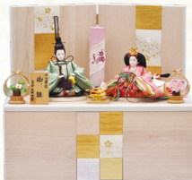
●木目白/箔ちらし金屏風・収納飾台 (間口50×奥行29.5×高さ44cm)