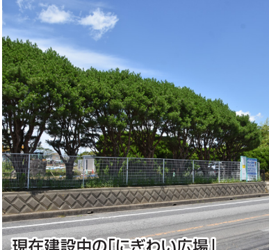
現在建設中の「にぎわい広場」

◆中学生向け認知症サポーター養成講座 7月29日開催 認知症の高齢者との関わり方を中学生に学んでもらう「中学生のための認知症サポーター養成講座」が、7月29日午前10時から印西市大森の市文化ホールで開催される。