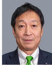
瀧田敏幸 (自民・現)